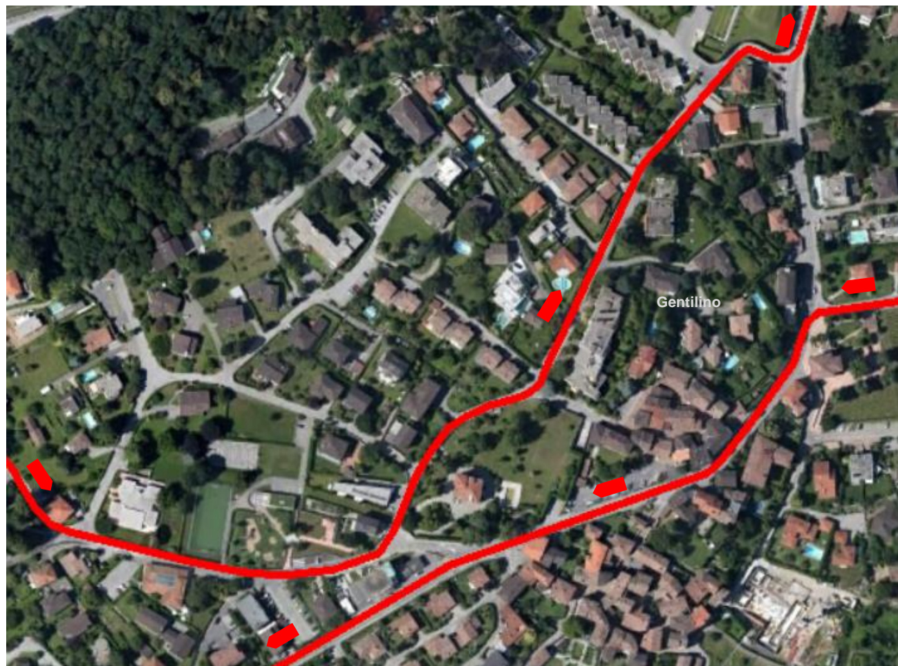
Passaggio di Gentilino (Collina d'Oro)