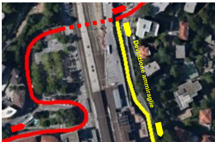
Passaggio della Stazione FFS di Lugano