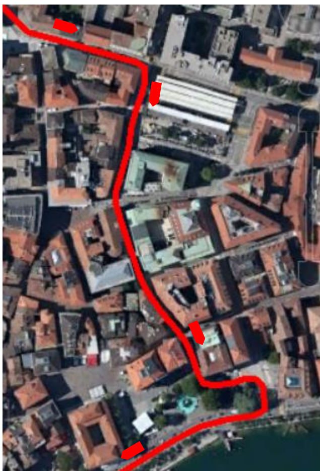
Passaggio Pensilina-Lungolago Lugano